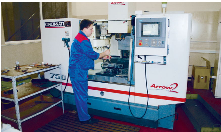
Рис. 8. Четырехкоординатный обрабатывающий центр с ЧПУ

Да, нам есть чем гордиться. Кругом – чистота и порядок. На участках станков с числовым программным управлением (ЧПУ) кондиционер поддерживает постоянную температуру, а в помещениях, где идет работа над датчиками, еще и влажность окружающего воздуха. Установка ла-