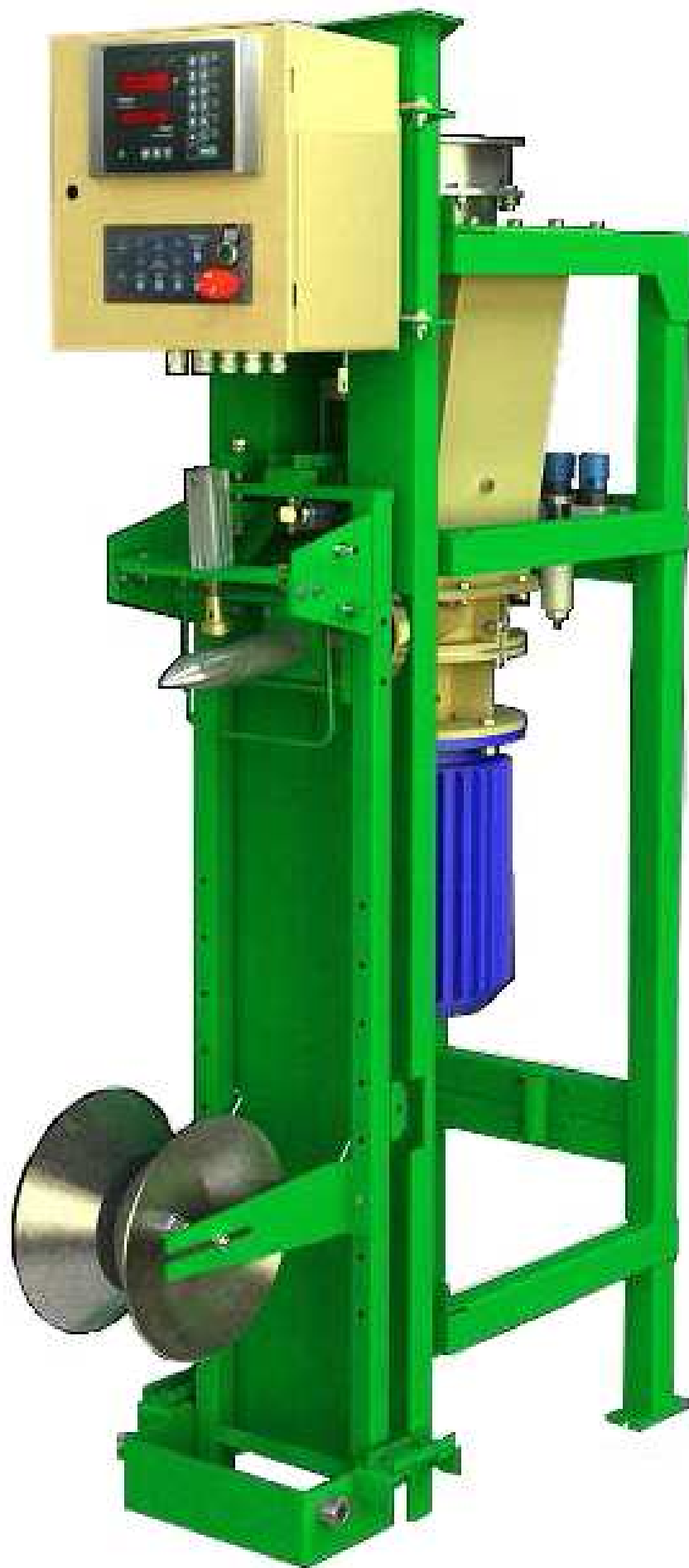
Рис.2. Общий вид дозатора.