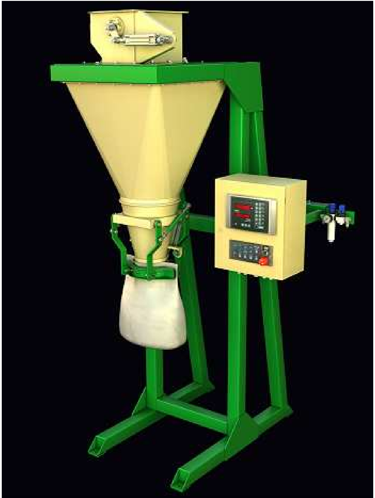
Рис.2. Общий вид.