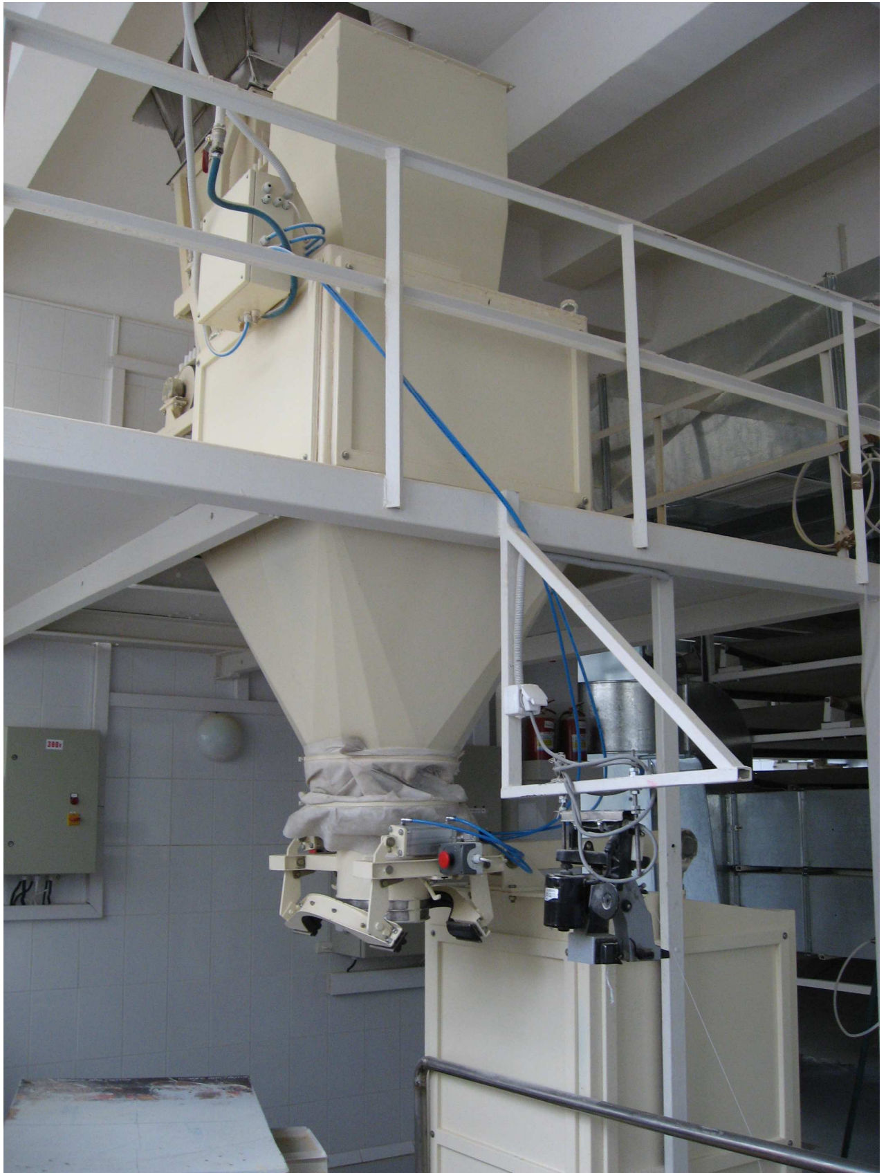
Рис.2. Общий вид дозатора.