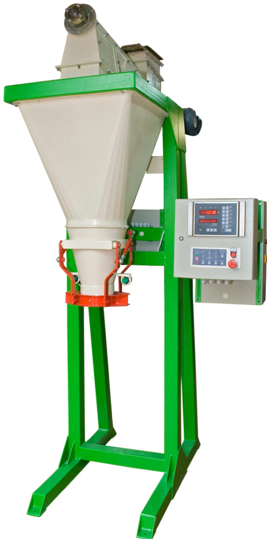
Рис.2. Общий вид.